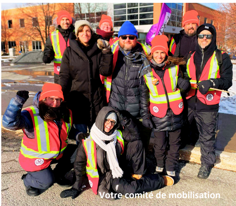
Votre comité de mobilisation

Derrière la grève, il y a des humains qui se sont mobilisés pour rendre le tout possible. Nous tenons à remercier celles et ceux qui ont fait un effort particulier pendant les deux semaines de grève!